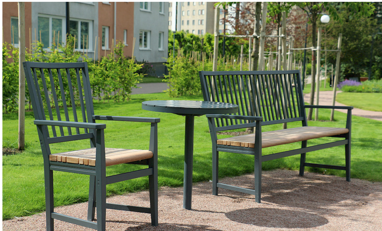
Leksand stol och soffa från Nola. Inspiration från den klassiska trästolen som tillverkades i Leksand under tidigt 1800-tal. Stolen och soffan är gjuten i återvunnen aluminium och pulverlackerad. Sitsen är i trä. Runt bord Parco från Nola i stål och trä.