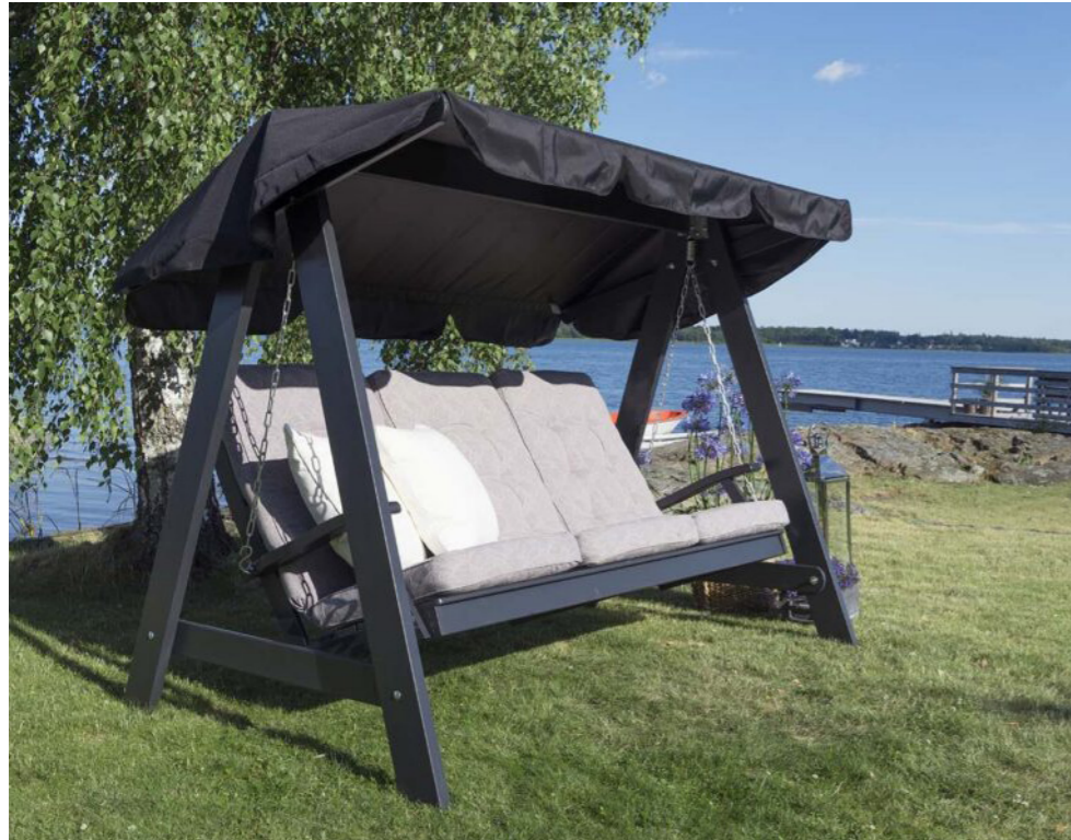
Dalom Hammock från Kila möbler