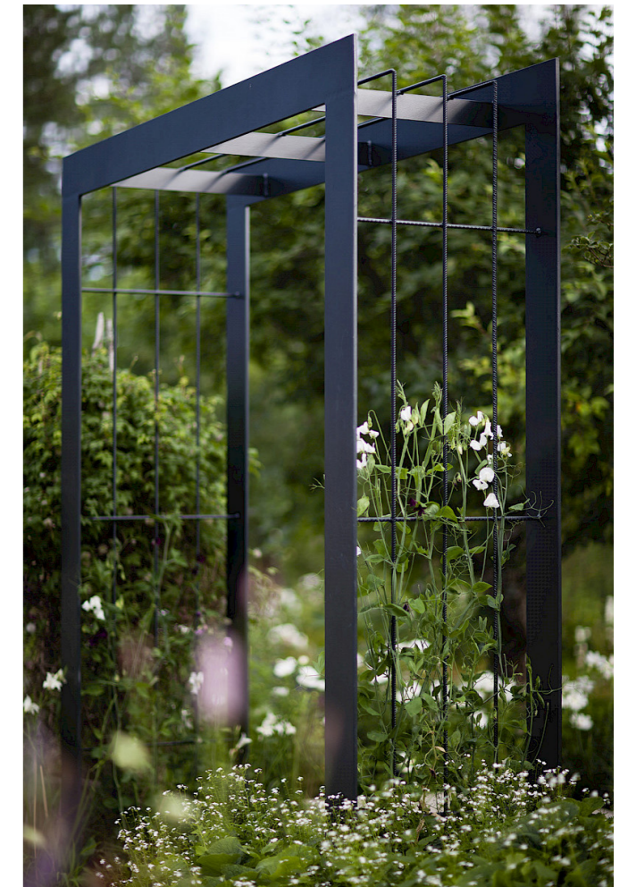
Nordfjell Collection Pergola Arch från Nola. Portal för klättrväxter i pulverlackerat stål.