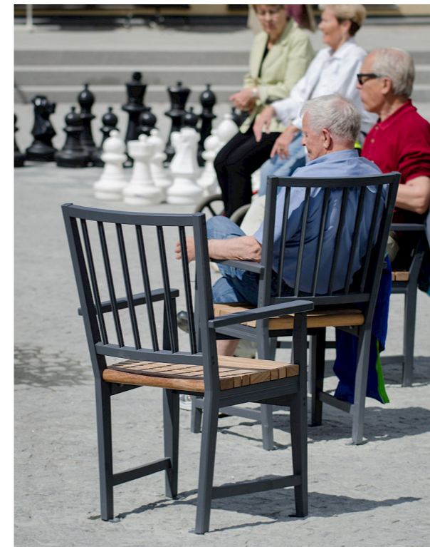
Med en lite högre sitthöjd (49 cm) är stolen tillgänglighetsanpassad. Armstöden är förlängda och greppvänliga.