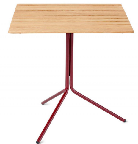
11:an bord från Nola. Flyttbart bord med stålstativ och träribbor.