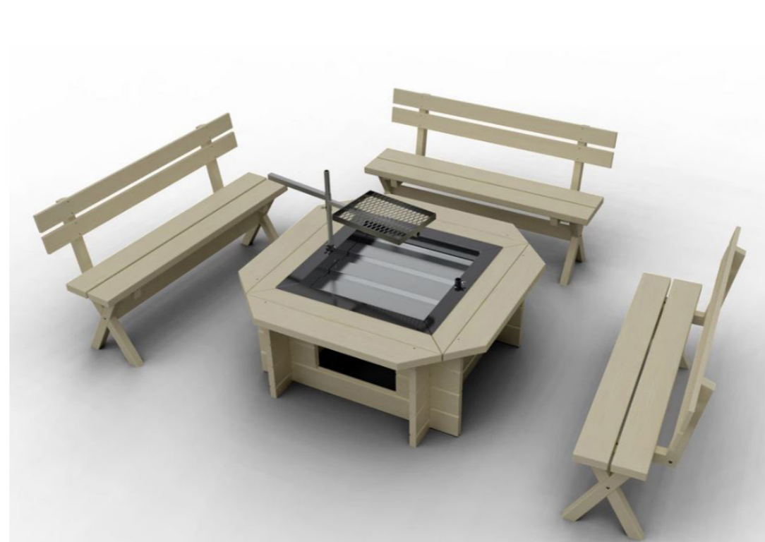
Grillplats med tre bänkar med ryggstöd från Sorselestugan. Plats för ved under grillen. Eldskål i plåt. Grillgallret kan vridas och är höj- och sänkbart.